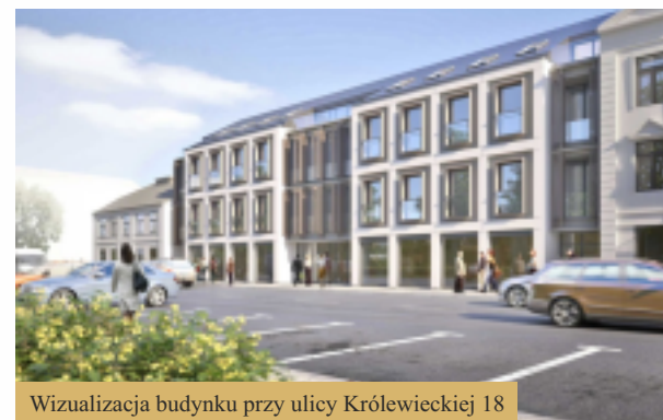
Wizualizacja budynku przy ulicy Królewieckiej 18

będzie stanowił naturalne zaplecze dla ulicy Tumskiej, przyczyniając się do dalszego rozwoju tej części Starego Miasta. W sąsiedztwie parkingu zaprojektowaliśmy budynek mieszkalno-usługowy Królewiecka 18, 27 mieszkań i 4 lokale usługowe to kolejny krok w rewitalizacji tej części miasta. Wprowadzanie się nowych