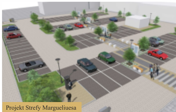
Projekt Strefy Margueliuesa

Kolejne przedsięwzięcie Agencji Rewitalizacji Starówki to budynek mieszkalno-usługowy przy Synagogałnej 7. Znowu uzupełniamy istniejącą tkankę wkomponowując nowy budynek w staromiejską strukturę. Będzie to czterokondygnacyjny budynek z lokalem użytkowym na parterze i 8 mieszkaniami powyżej. „Plomba” pomiędzy istniejącymi budynkami już dziś uzupełnia pierzeje ulicy Synagogałnej. Mieszkania o powierzchni od 50 do 70 m 2 , z balkonami na poddaszu, to kolejna nasza propozycja nowych lokali na Starówce. Realizacje jak i plany inwestycyjne to kwestie bardzo złożone. Staramy się obserwować i reagować na aktualne potrzeby oraz trendy.