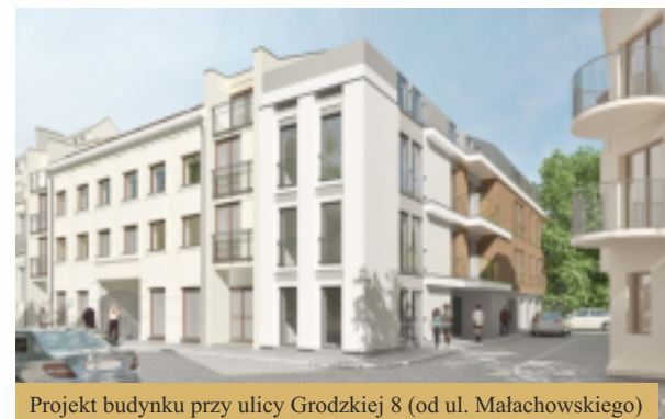
Projekt budynku przy ulicy Grodzkiej 8 (od ul. Malachowskiego)

Agencja Rewitalizacji Starówki to także administrator Starego Rynku, na którym w 2016 i 2017 wyremontowaliśmy małą scenę oraz przeprowadziliśmy szereg remontów ogródków kawiarnianych. Najważniejszym przedsięwzięciem był remont płockiej Afrodyty. Pokryta patyną perła Starówki odzyskała dawny blask i znowu bawi nas wieczorami pokazami muzyki, światła i wody. Pracujemy, słuchamy i staramy się wychodzić naprzeciw oczekiwaniom mieszkańców, aby miasto piękniało w oczach.